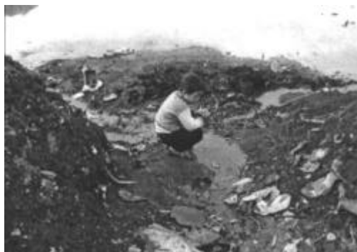
Gráfico 4 Niño asiático comiendo sobre una montaña de cenizas originadas por los residuos eléctricos y electrónicos de origen de EEUU 1