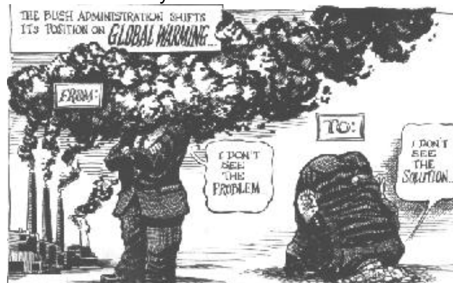
Política de EEUU respecto al cambio climático. The Economist. 8 de Junio 2002

Un viaje de 1000 Km en un coche de última generación implica la emisión a la atmósfera de unos 50 Kg. de Carbono. Un viaje trasatlántico en avión supone unas emisiones de unos 425 Kg. de carbono por pasajero