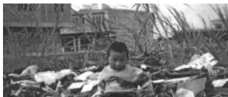
Gráfico 3. Montaña de residuos eléctricos y electrónicos originados en EEUU localizada en Asia 1

Hay otros transportes de residuos derivados del hecho de que la Convención de Basilea tenga algunas carencias legales, como la clasificación no exhaustiva de residuos peligrosos: por ejemplo, los residuos eléctricos y electrónicos, no han sido incorporados en la lista debido a la presión de los Estados Unidos.