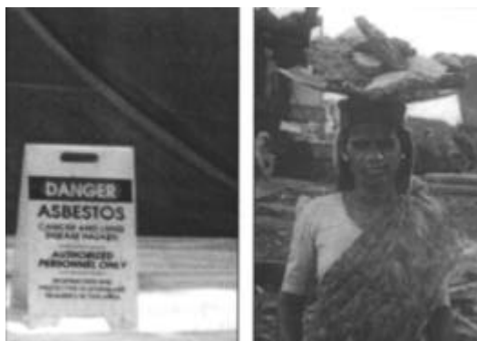
Gráfico 2. Diferente trato de los amiantos encontrados en los barcos en EEUU (izquierda) e India (derecha). La diferencia de riesgos para los trabajadores es evidente.

Hay muchas sustancias tóxicas que están en los barcos y es normal que se produzcan fenómenos de contaminación, por ejemplo de amianto (sustancia cancerígena), así como vertidos de sustancias tóxicas al mar o en las superficies de trabajo. En las áreas de desmantelamiento en estos países se pueden encontrar niveles altos de contaminación por metales pesados, PCB's y TBT's 31 .