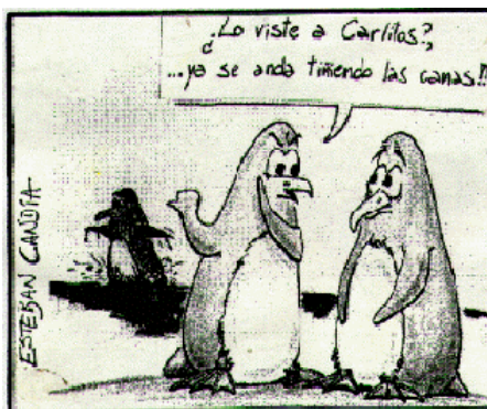
Ecosignos virtual. Ecohumor n1, 1996.

También en este capítulo nos plantearemos algunas cuestiones: ¿se puede compensar a las comunidades que reciben las consecuencias? ¿Puede ser monetaria esta compensación? ¿Cuáles son los instrumentos jurídicos que pueden obligar a las empresas a responsabilizarse de sus pasivos ambientales?