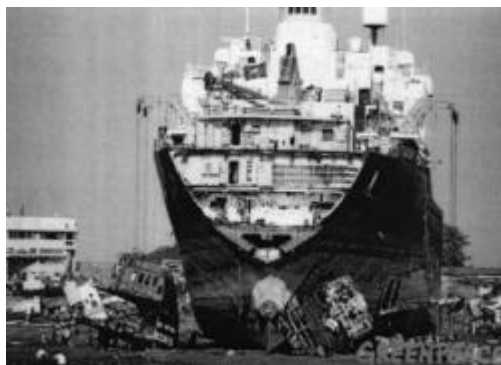
Gráfico 1. Desmantelado de un barco alemán en Alang (India).

Un ejemplo claro de que el problema continúa es el desmantelamiento de los barcos al final de su vida útil. Las industrias de los países más ricos, propietarias de los barcos de transporte, una vez estos han finalizado su vida útil, no los desmantelan en sus territorios, si no que los realizan en los países pobres donde los costes son inferiores, como India, Bangladesh, Pakistan, China o Turquía, principalmente debido a una mano de obra más barata y a unos estándares ambientales y de seguridad inadmisibles en el contexto del país rico de origen.